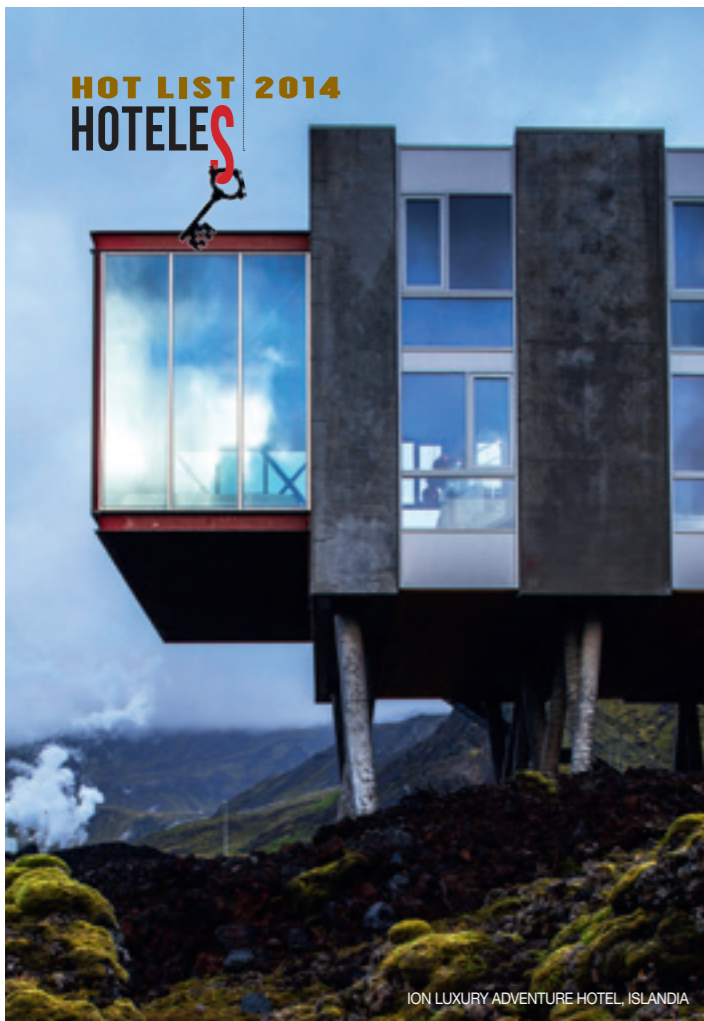
ION LUXURY ADVENTURE HOTEL, ISLANDIA