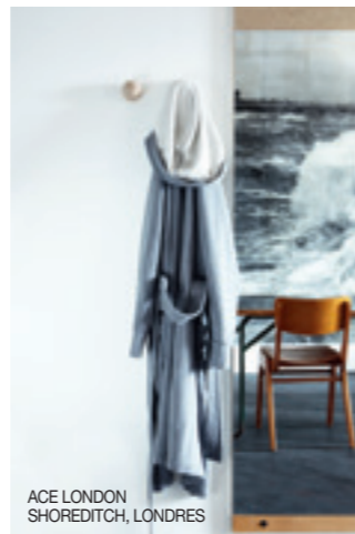
ACE LONDON SHOREDITCH, LONDRES

🔥 Puerto Escondido es una de las diez mecas de los surfistas, pero carecía de buenos hoteles. En un tramo de playa virgen, el Grupo Habita ha vuelto a acertar con este refugio de inspiración surfera con lujos como las pequeñas piscinas privadas o los masajes en tu habitación. Los 16 bungalós están rodeados de jardines de roca y cactus. Podrás montar a caballo, ayudar a liberar a los bebés tortuga en el océano o nadar