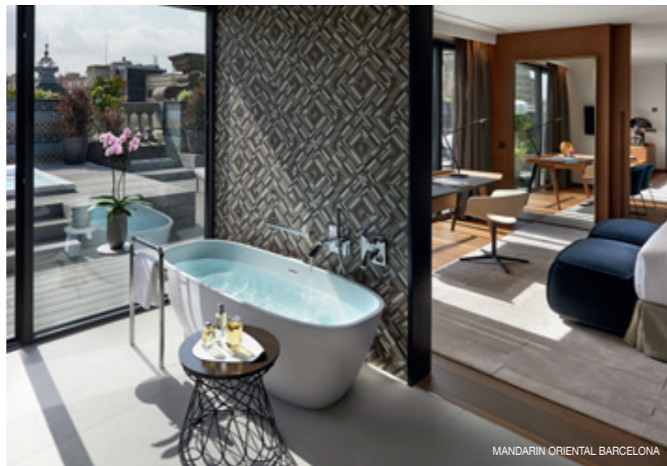
MANDARIN ORIENTAL BARCELONA

🍷 A los cinco años de su apertura, el Mandarin de Barcelona sigue dándonos de qué hablar. Esta vez por la inauguración, en un edificio anexo, de 17 espectaculares suites