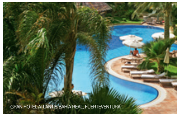
GRAN HOTEL ATLANTIS BAHIA REAL, FUERTEVENTURA

Rompedor, ultramoderno, estimulante y obsesionado por el medioambiente, así es el nuevo resort de la isla de Vieques. 22 habitaciones y un restaurante del chef José Ignacio (elblok.com). HD: desde 125€.