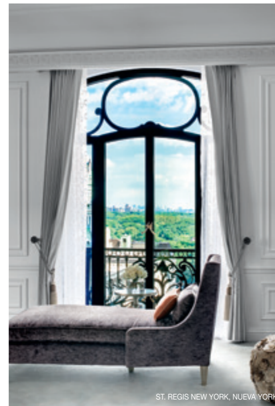
ST. REGIS NEW YORK, NUEVA YORK

ST. REGIS NEW YORK , Nueva York 🔥 Discreto, como ha sido siempre, el más europeo de los míticos hoteles de la Quinta Avenida se ha sometido a una buena cirugía estética en