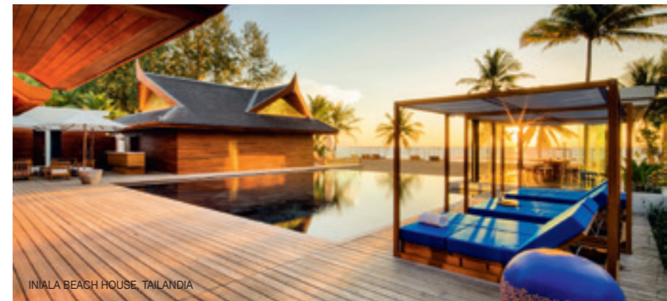
INIALA BEACH HOUSE, TAILANDIA

ION LUXURY ADVENTURE HOTEL , Parque Nacional Thingvellir 🔥 Selfoss; ioniceiland.is y design-hotels.com. HD: desde 267€. 📍 📞 📺 📺