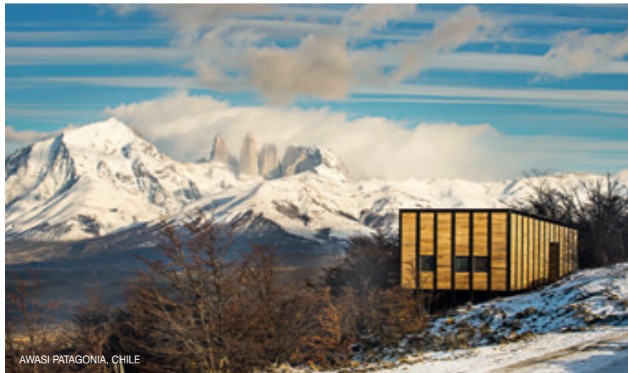
AWASI PATAGONIA, CHILE