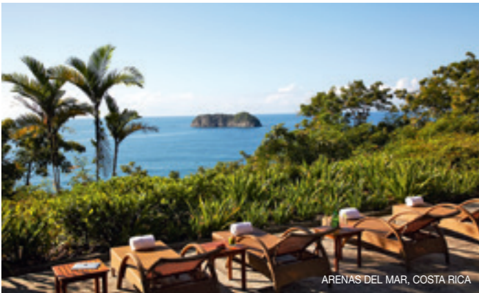
ARENAS DEL MAR, COSTA RICA

La cadena Firmdale y sus propietarios y diseñadores, Tim y Kit Kemp, se han vuelto a superar con este nuevo hotel con ambiente de 'pueblo urbano'. Situado en pleno Soho londinense, dispone de 91 habitaciones, 24 apartamentos, 13 tiendas independientes, un restaurante con terraza y hasta un cine. Lo más espectacular es su espacio para eventos, The Croc, con pista de baile y una bolera de los años 50 (firmdalehotels.com. HD: desde 600€).